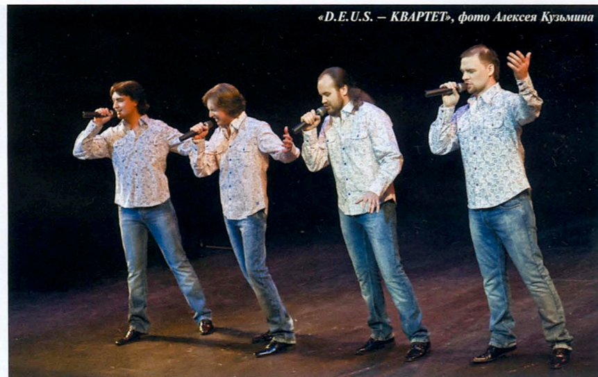
«D.E.U.S. — КВАРТЕТ»

Впрочем, первыми в тот вечер вышел на сцену вовсе не D.E.U.S.-